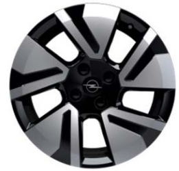
DZIAL / DZIAL