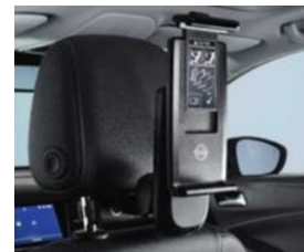
2 univerzális tablet tartó 2 moduláris csatlakozó