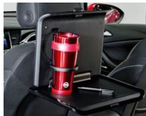
2 pohártartós asztalka 2 moduláris csatlakozó