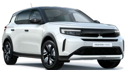
Arktis fehér (alapfényezés)