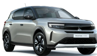
Kristall ezüst (metálfényezés)