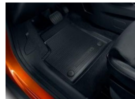
Gumiszőnyeg garnitúra első és hátsó