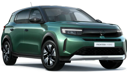
Terep zöld (metálfényezés)