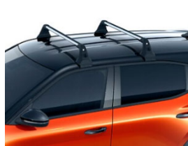
Keresztirányú tetőrudak (tetősín nélküli járműre)