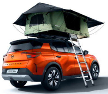
2 személyes tetősátor