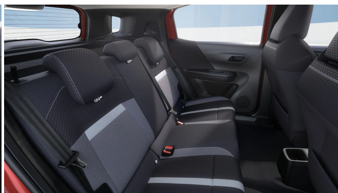
Gap kárpit, szövet, szürke/fekete (BMFR)