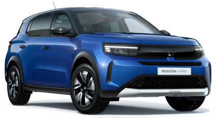
Effekt kék (metálfényezés)