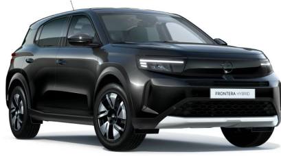
Karbon fekete (metálfényezés)