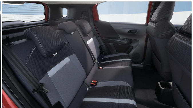
Gap kárpit, szövet, szürke/fekete (BMFR)