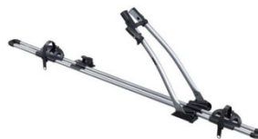
Freeride 532 1-db-os kerékpártartó