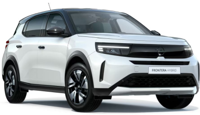
Arktis fehér (alapfényezés)