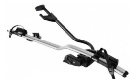
Expert 298 1-db-os kerékpártartó