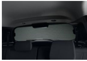
Sötétítő hátsó ablakra