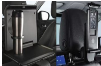
1 asztalka + 1 univerzális tablet tartó + 2 csatlakozó