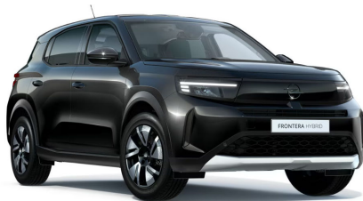
Karbon fekete (metálfényezés)