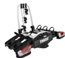
Coach 276 3 db-os bicikli tartó