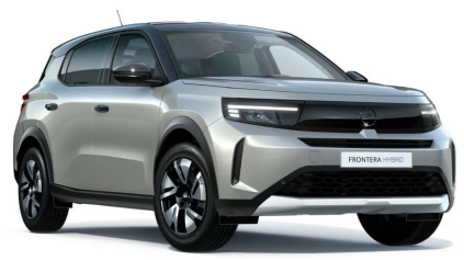
Kristall ezüst (metálfényezés)