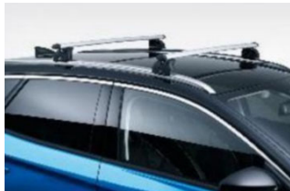
Keresztirányú tetőrudak hosszanti tetősínhez