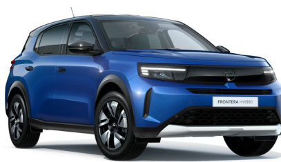
Effekt kék (metálfényezés)