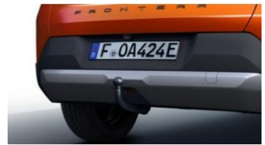
Szerszám nélkül leszerelhető vonóhorog (5 személyes kivitelhez, 17768 gyártástól)