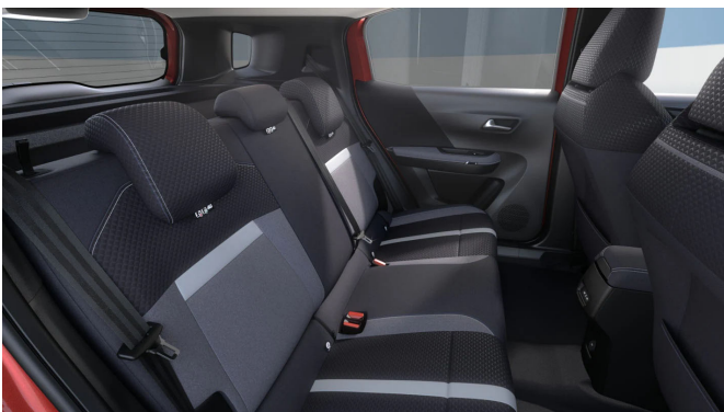
Gap kárpit, szövet, szürke/fekete (BMFR)