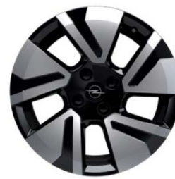
DZIAI / DZIAL