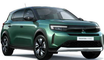
Terep zöld (metálfényezés)