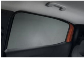
Sötétítő hátsó oldalsó ablakokra 2 db-os