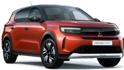
Kanyon narancs (metálfényezés)