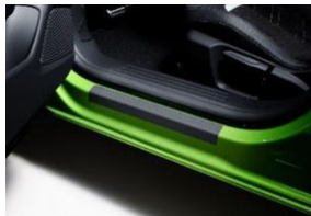
Küszöb védő borítás, 2db-os szett