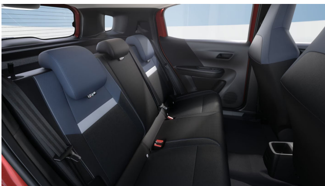
Riaz kárpit, szövet, kék/fekete/sötétszürke (BLFX)